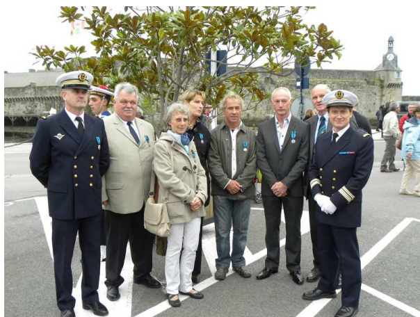
Concarneau - 5 octobre Remise de Mérite maritime