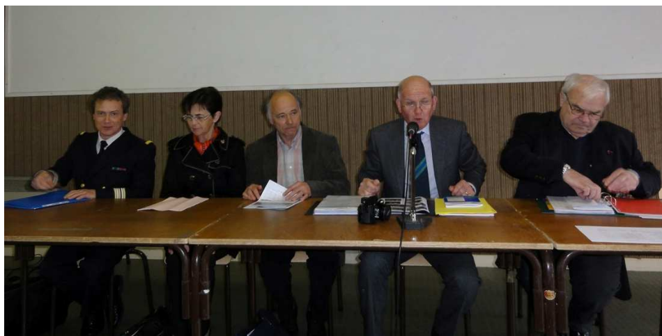
Assemblée générale de Lanildut - 31 mars