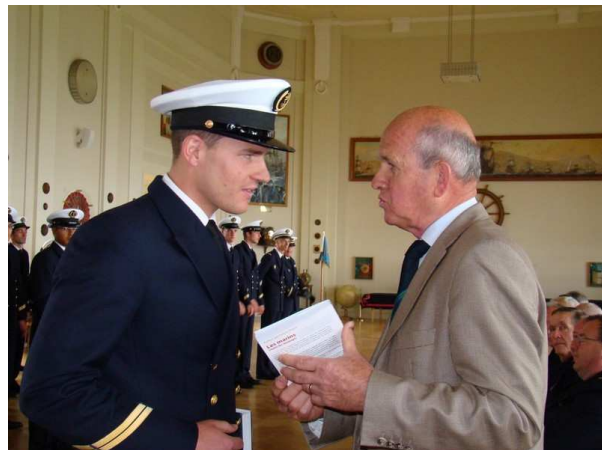
C.I.N Brest - Remise de prix au nom du Mérite maritime