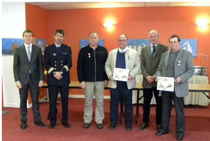
Gens de Mer Brest - 19 octobre