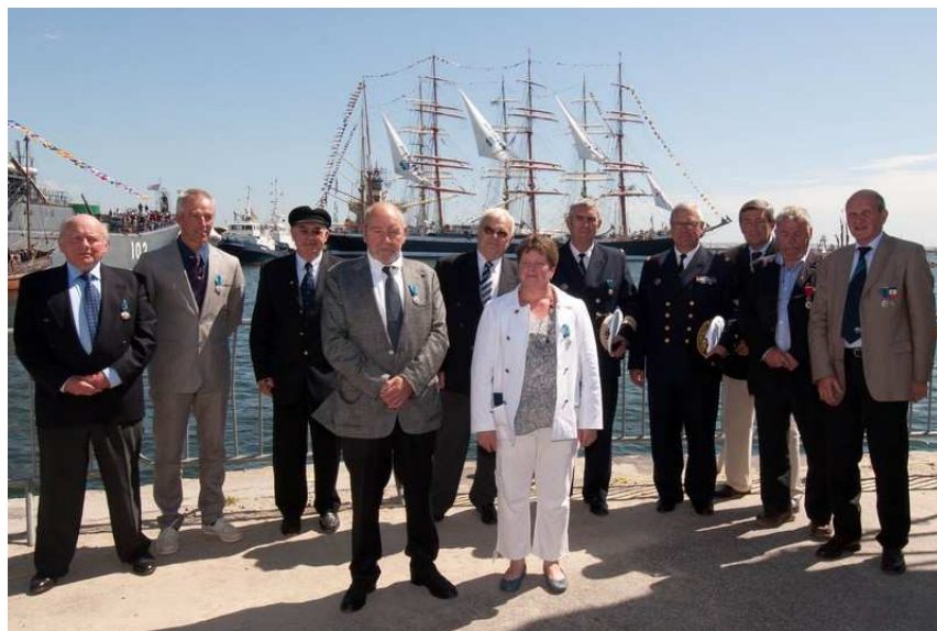
Tonnerres de Brest - 17 juillet