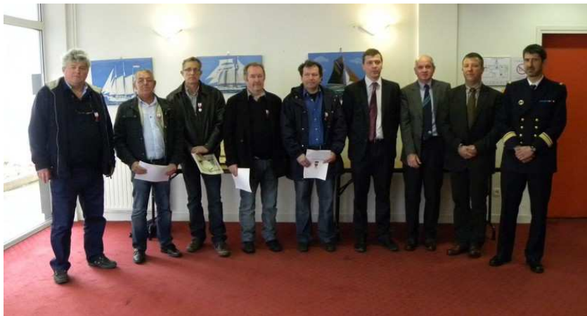
Gens de Mer Brest - 25 avril Remise de médailles d'Honneur