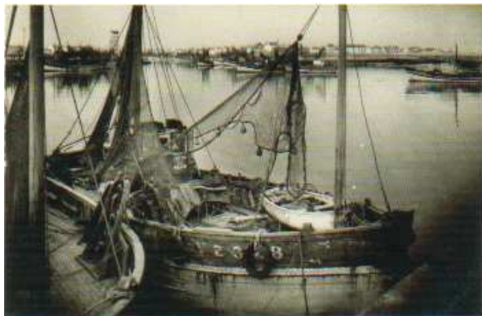
Année 1950: Le "malamok" "Credo du marin" - Le Guilvinec