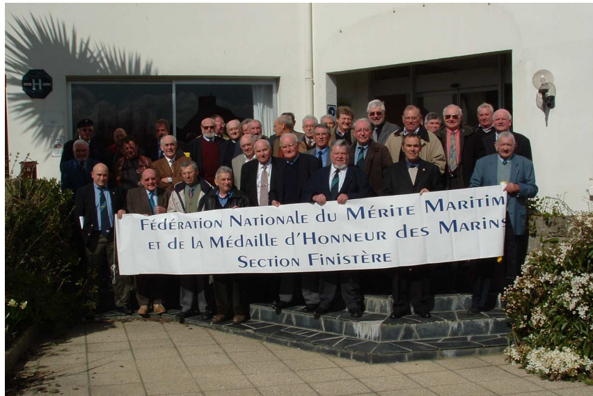
Assemblée Générale 2006 à Roscoff