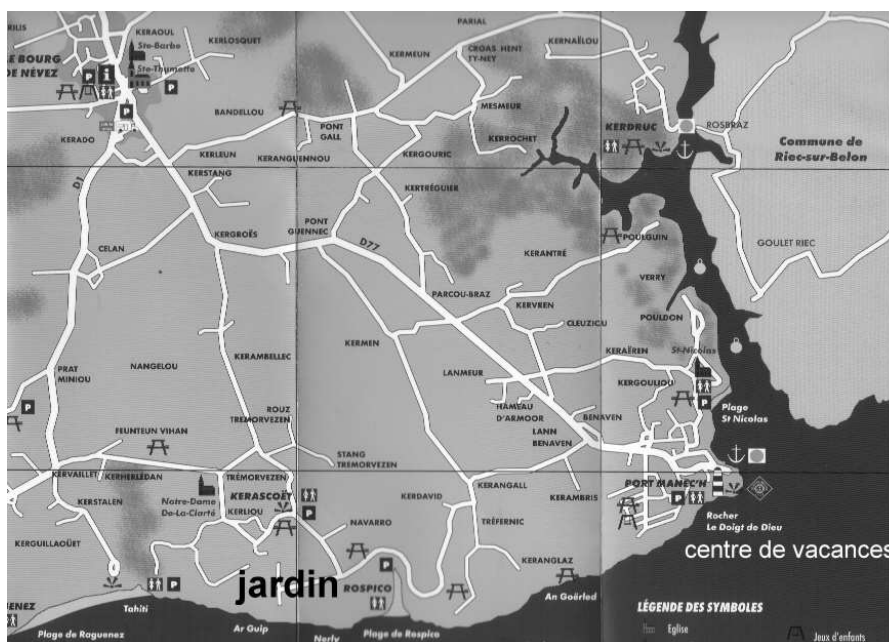
Plan d'accès au Centre de vacances de Port Manec'h et au jardin de Rospico