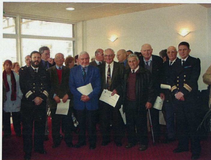
Remise de diplôme de Fidélité à la section du Finistère