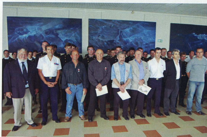
Remise de Médailles d'Honneur à Concarneau