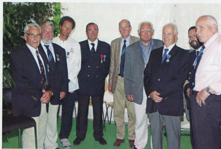
Remise de médailles du Mérite maritime à Brest 2008