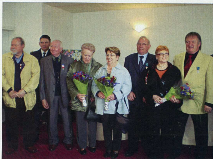
Remise de décorations à l'A.G de Brest