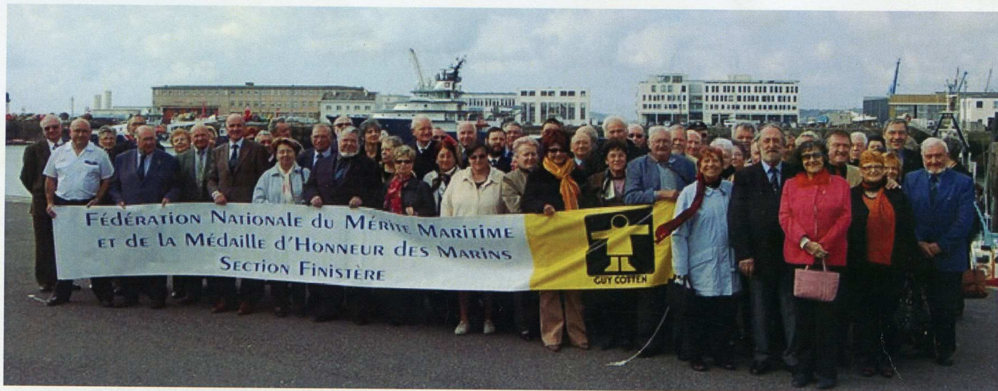
vingtième anniversaire de la section - Assemblée générale de Brest