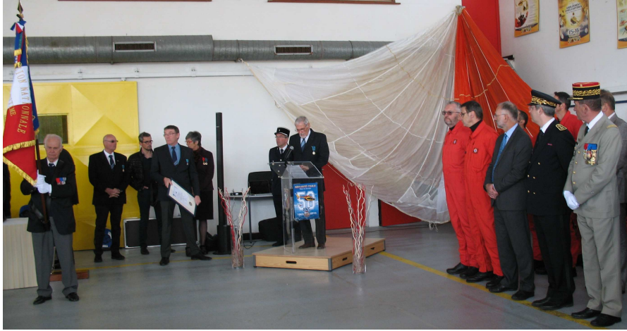
Cérémonie sur la base de la sécurité civile de Pluguffan le 30 avril