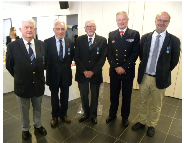
Remise de la croix de chevalier à Brest le 20 juin