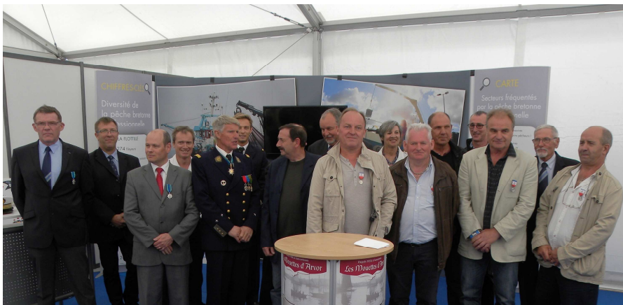
Remise de 8 médailles Mérite Maritime et médailles d'Honneur à Brest le 13 juillet