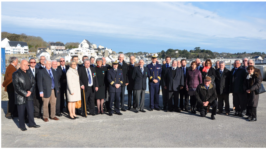
Assemblée générale à Plouhinec le 2 avril