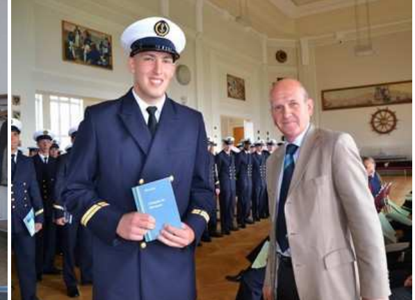
Remise de prix au C.I.N de Brest