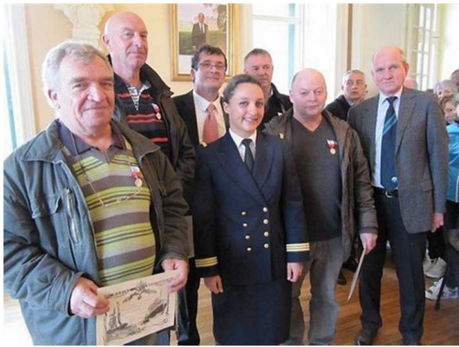
Remise de médailles d'Honneur à la Mairie du Guilvinec