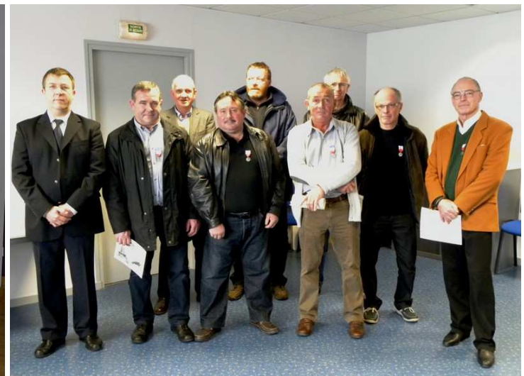
Remise de médailles d'Honneur à Roscoff