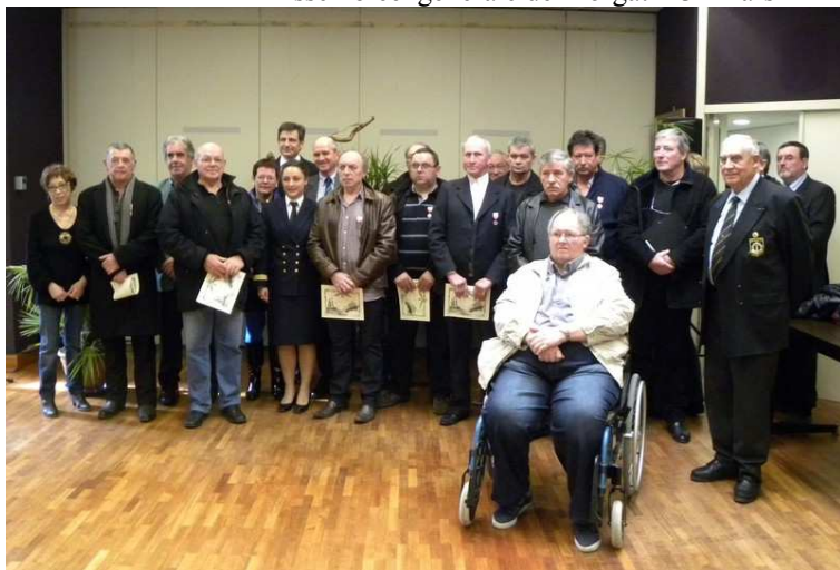
Remise de médailles d'Honneur à la Mairie de Douarnenez