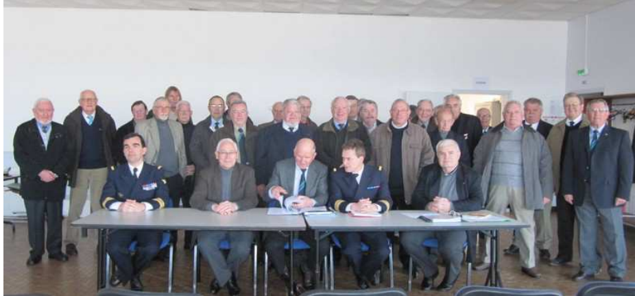
Assemblée générale de Morgat - 31 mars