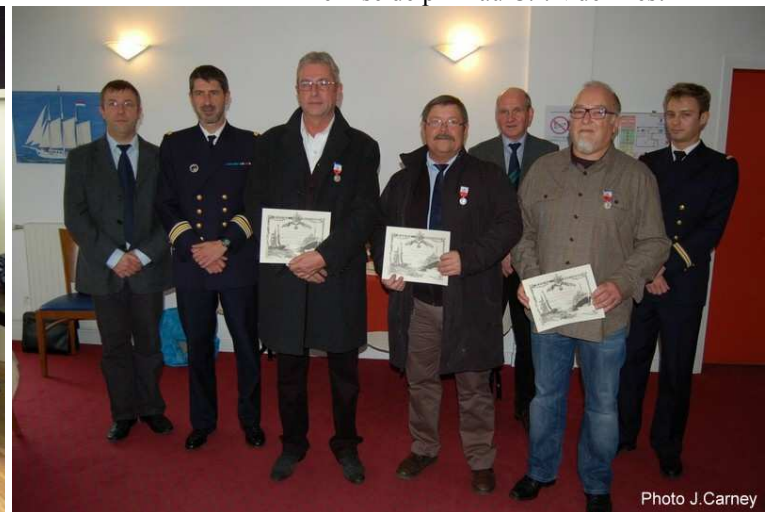
Remise de médailles d'Honneur à l'hôtel des Gens de Mer de Brest