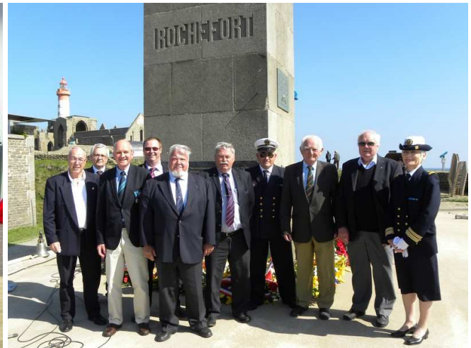
Cérémonie au Mémorial de la pointe Saint-Mathieu