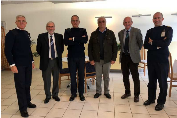
Visite et déjeuner au Centre d'Instruction Navale de Brest