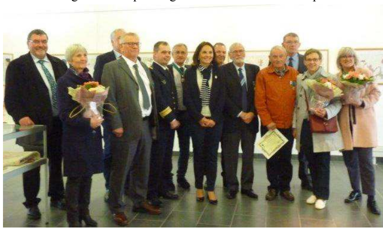
Les médaillés décorés à l'issue de l'Assemblée Générale