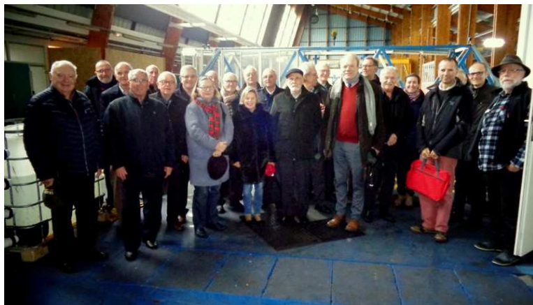
Visite de l'IFREMER en coopération avec l'IFM de Brest