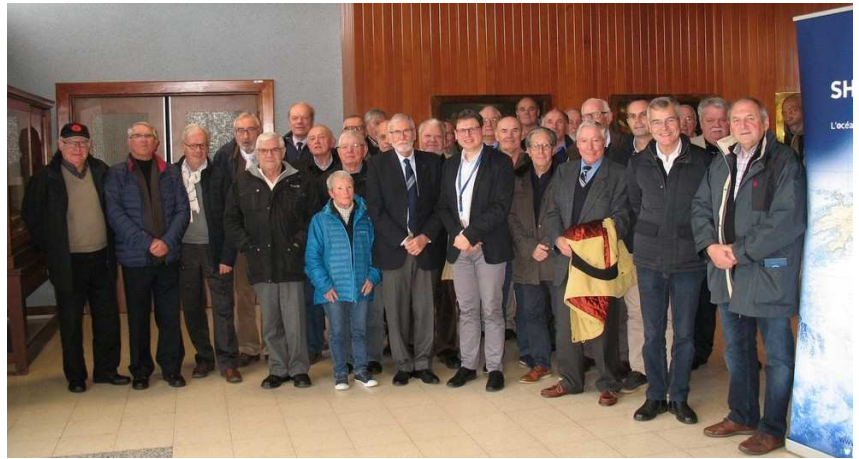
Visite du Service Hydrographique et Océanographique de la Marine à Brest