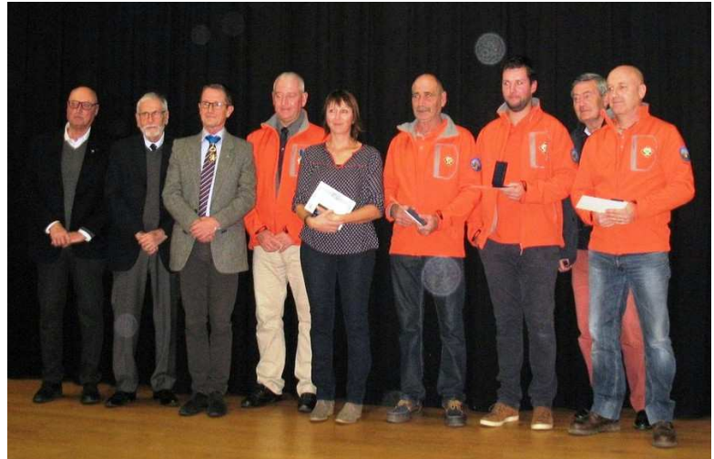
SNSM de Brignogan Plages remise de Médailles