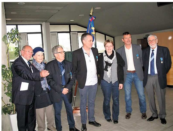
IUEM de Plouzané Cérémonie de remise de croix du Mérite Maritime