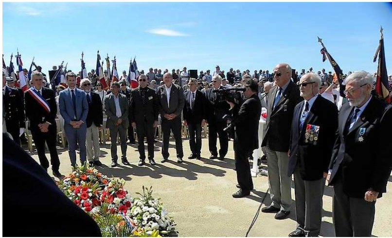
Mémorial National des Marins Morts pour la France - Dépôt de gerbes