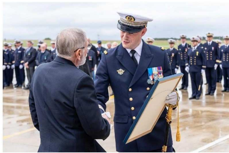
Lanvéoc Remise de la Lettre de Reconnaissance à la flottille 33F