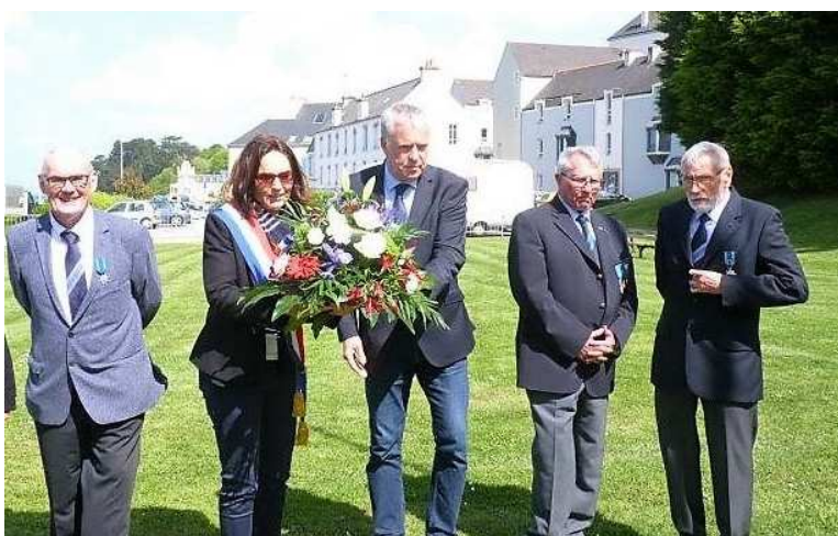
Assemblée générale-dépôt de gerbe à la stèle des marins péris en mer