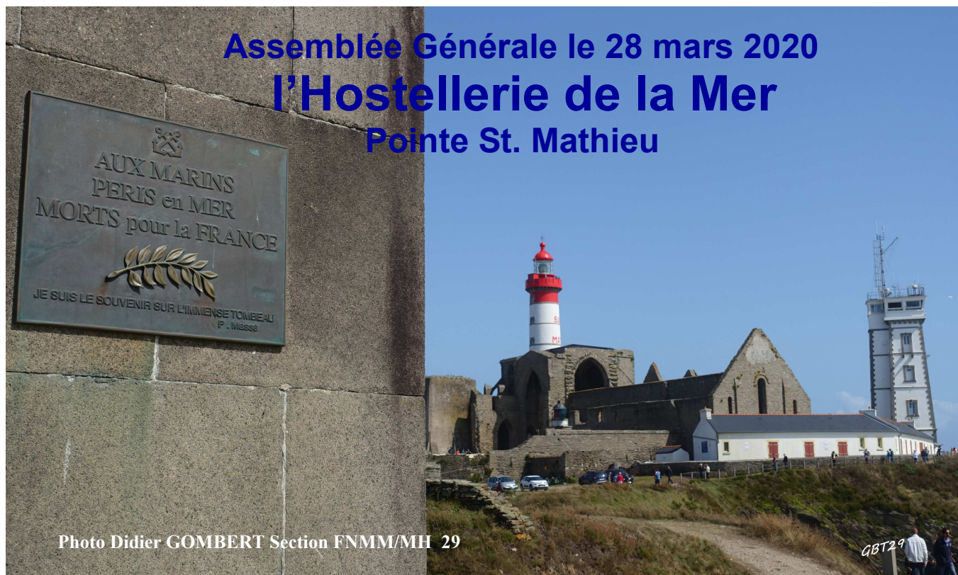
Section FNMM/MH 29

Le président et les membres du Bureau vous présentent leurs meilleurs vœux pour 2020