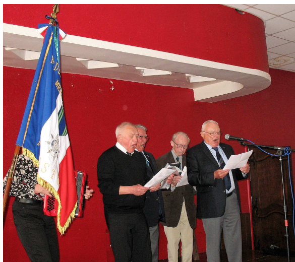
La marche du Mérite Maritime interprétée pour la première fois par nos amis du groupe Mouez Port Rhu