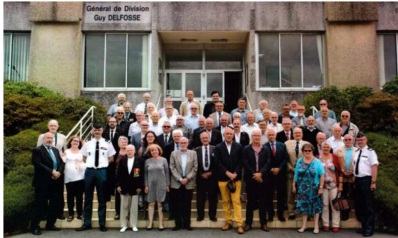
Les associations patriotiques en visite à l'école de gendarmerie de Châteaulin