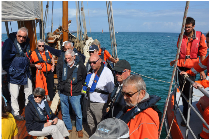
SNSM de Plouescat - embarquement sur la bisquine La Cancalaise