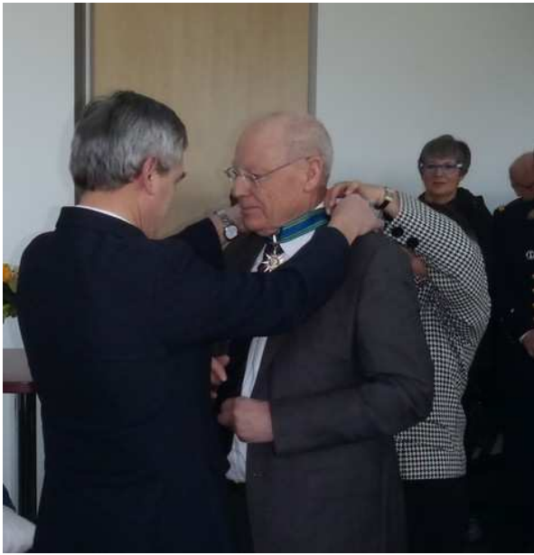
14 février - Fouesnant