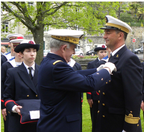
8 mai - Morlaix