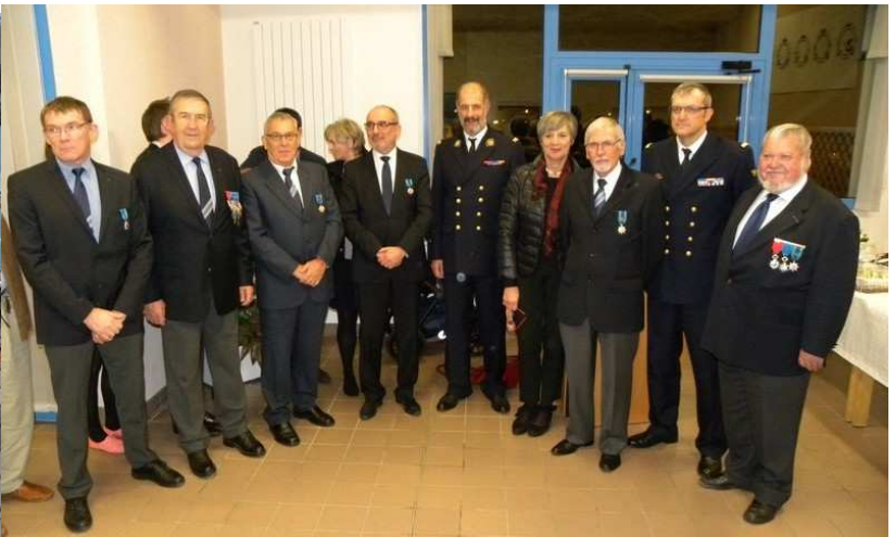
27 novembre remise de médailles au Lycée Professionnel Maritime du Guilvinec