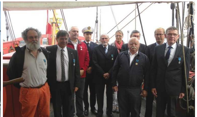
14 août remise de médailles à bord de L'Hermione à Brest