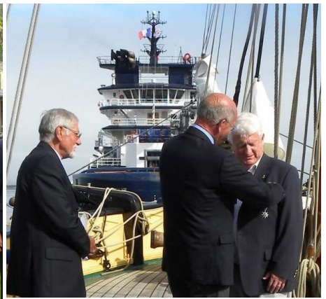
15 juillet à bord de La Recouvrance à Brest