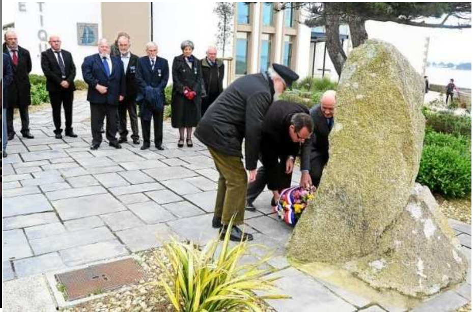
4 avril - A.G de Concarneau