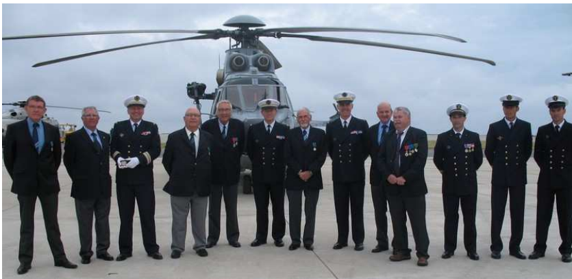
22 juin BAN Lanvéoc-Poulmic remise de lettre de reconnaissance à la 32F