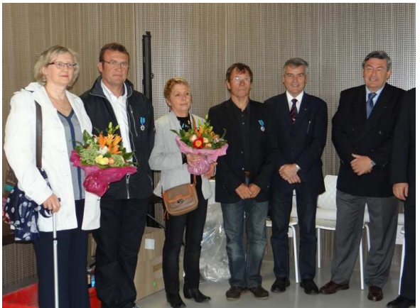
25 avril - Roscoff