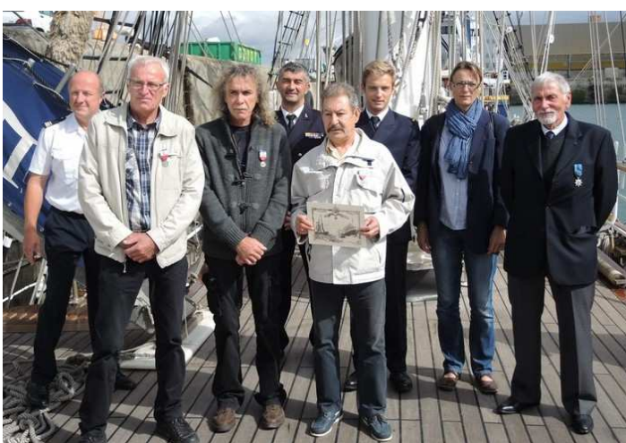
18 septembre remise de médailles d'Honneur à bord du Bélem