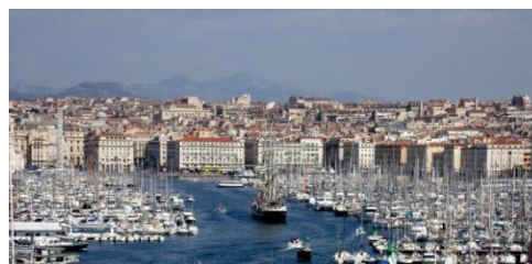
Vieux-Port vu du Palais du Pharo