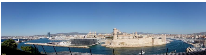
MuCem et Fort Saint Jean vus du Palais du Pharo

Un bureau de vote composé d'un président et de 4 assesseurs désignés par le Conseil d'Administration procédera au dépouillement. Les résultats du scrutin seront annoncés par le Président du bureau de vote en fin de première partie de l'Assemblée Générale.