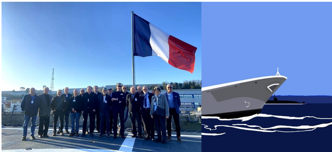
Dessin Eric Berthou : Visite de la FREMM Normandie à la base navale de Brest.