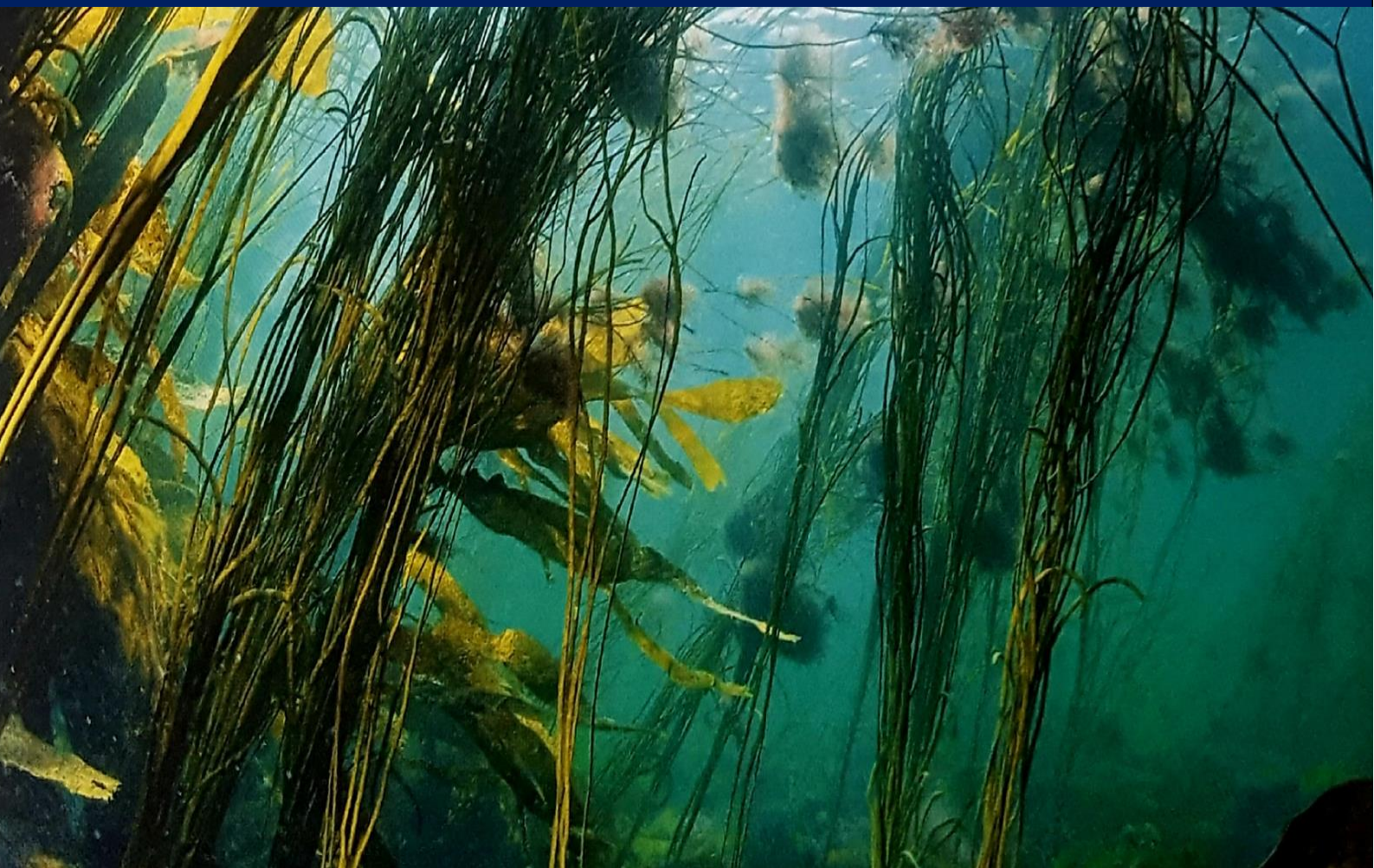
BZH20-La faune sous-marine en Bretagne : mer d'Iroise

Assemblée générale le 11 avril 2026 à 9 h 30 à l'espace Léo Lagrange à Camaret-sur-mer