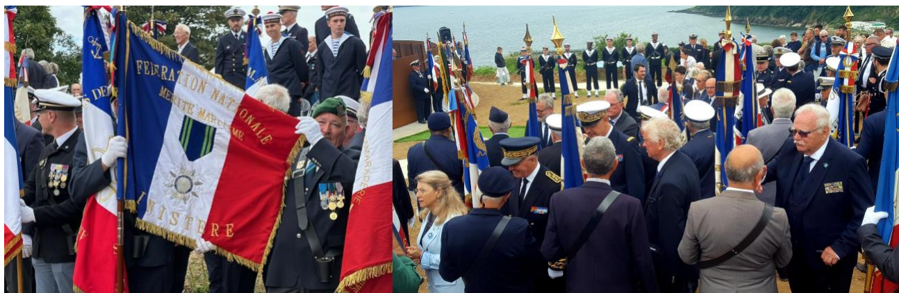
DR : Inauguration du Mémorial des Marins de Mers el kébir au belvédère de Sainte-Anne du Portzic