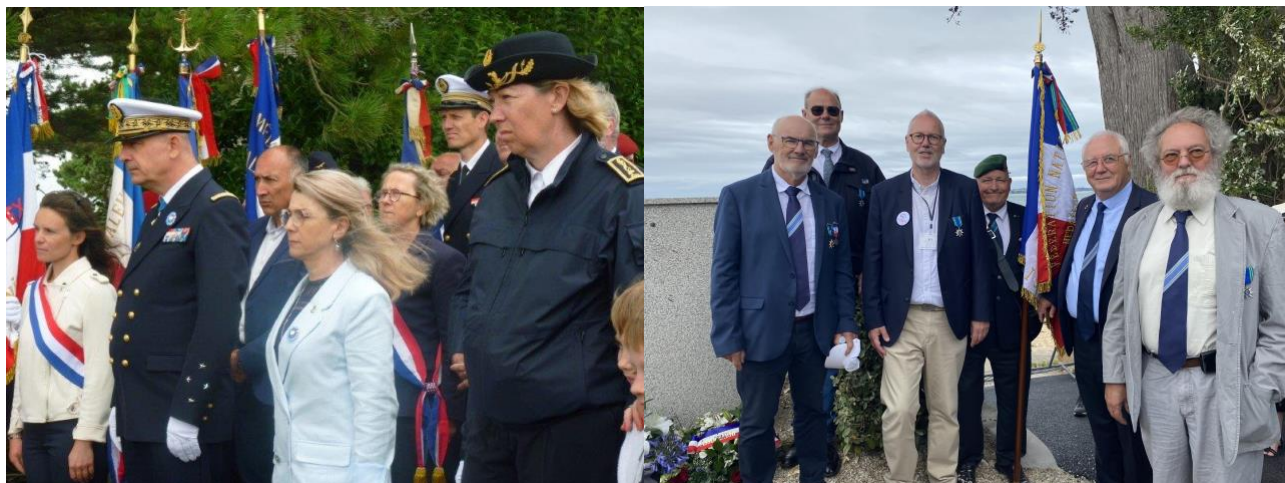
DR : Commémoration du départ de 300 volontaires bretons de Carantec pour rejoindre les forces FFL.