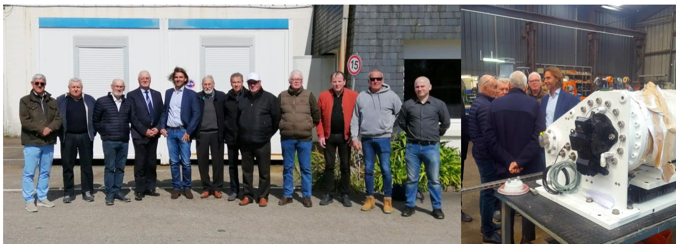
Visite de l'entreprise Bopp par une délégation de la section Finistère du Mérite Maritime.