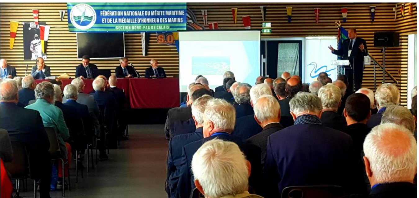
Boulogne sur Mer : Participation au Conseil d'Administration et au Congrès 2022.