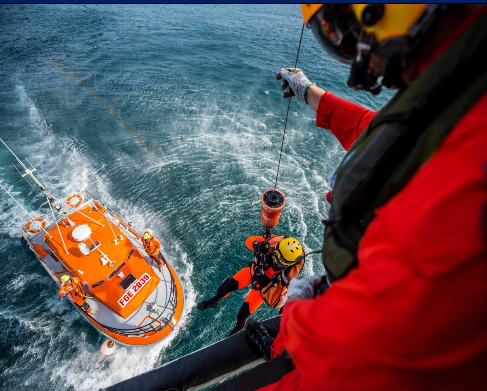
DR Photo de couverture Dragon 29

Assemblée générale le samedi 25 mars 2023 à 10 heures au village vacances de Kerbeuz à Trégarvan